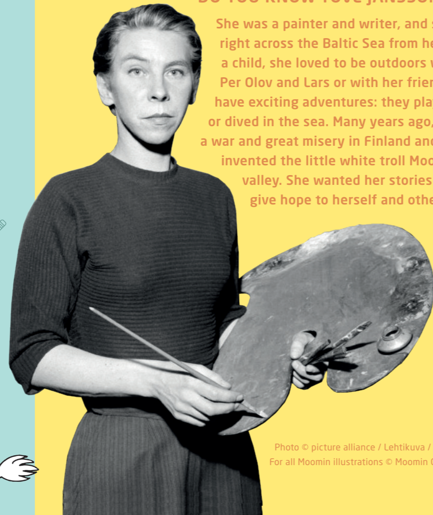
For all Moomin illustrations © Moomin Characters™

Come and meet Moomin, his family, and his friends!